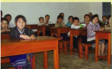
←教室の子どもたち