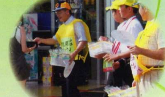
薬物乱用防止街頭キャンペーン