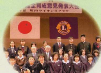
青少年健全育成意見発表会