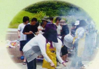
児童養護施設海祭り