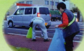
世界奉仕デー駅前清掃活動