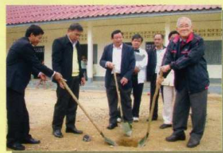
↑ 記念の植樹の様子