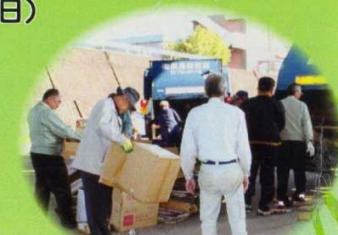
廃品回収リサイクル運動